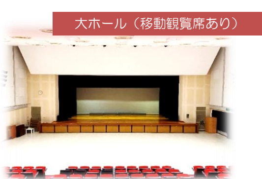
大ホール（移動観覧席あり）